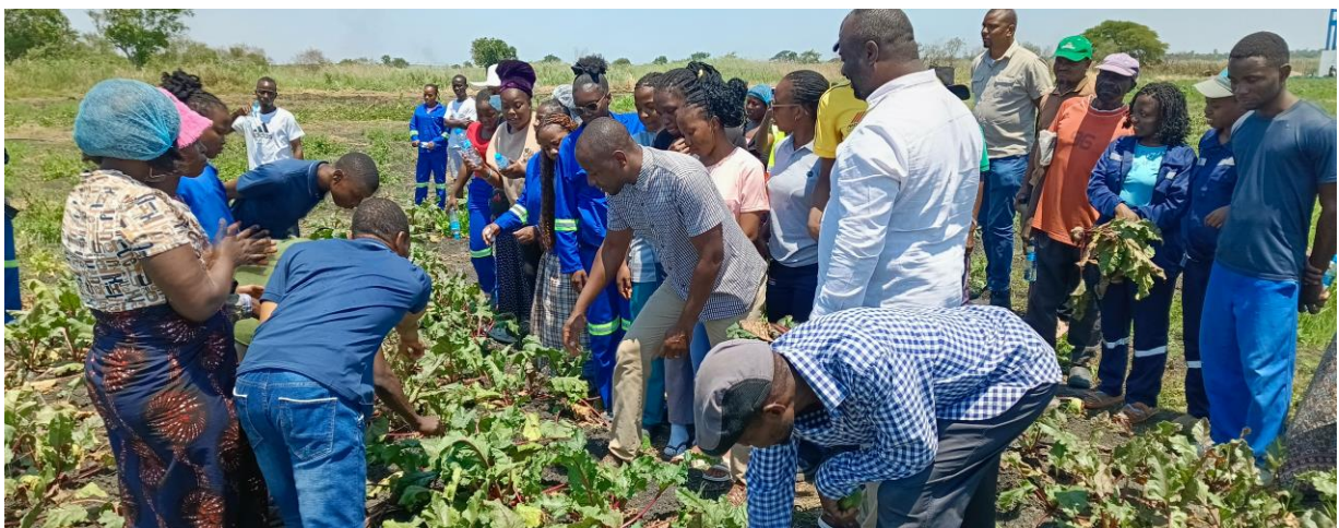
Foto: Participantes da Cerimónia de Encerramento do projecto colhendo livremente a Beterraba produzida pelos jovens do projecto