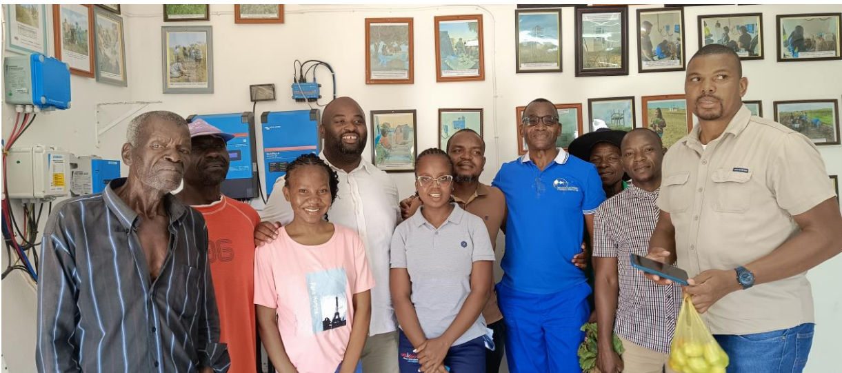
Foto: Rogério Chiau - Director Provincial da Juventude, Emprego e Desporto da Província de Maputo na sala de treinamento do Centro de Pesquisa, Treinamento em Energias Renováveis e Produção Sustentável de Alimentos da Universidade Pedagógica de Maputo