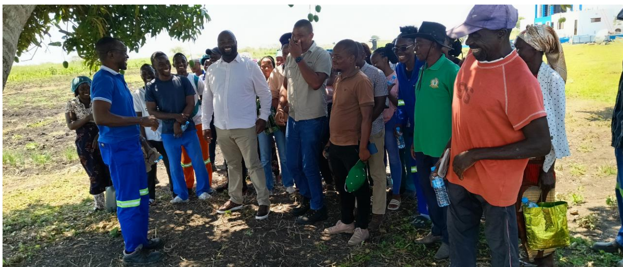
Foto: Rogério Chiau - Director Provincial da Juventude, Emprego e Desporto da Província de Maputo desafiado a trabalhar na Sala natural de trabalho do Centro