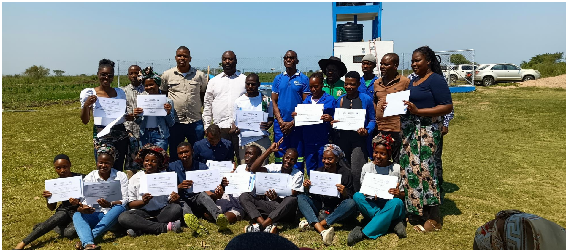
Director Provincial da Juventude, Emprego e Desporto da Província de Maputo com os jovens graduados do Projecto “Nós Jovens Produzindo Alimentos para o Bem Estar das Comunidades” no Centro de Pesquisa, Treinamento em Energias Renováveis e Produção Sustentável de Alimentos da Universidade Pedagógica de Maputo