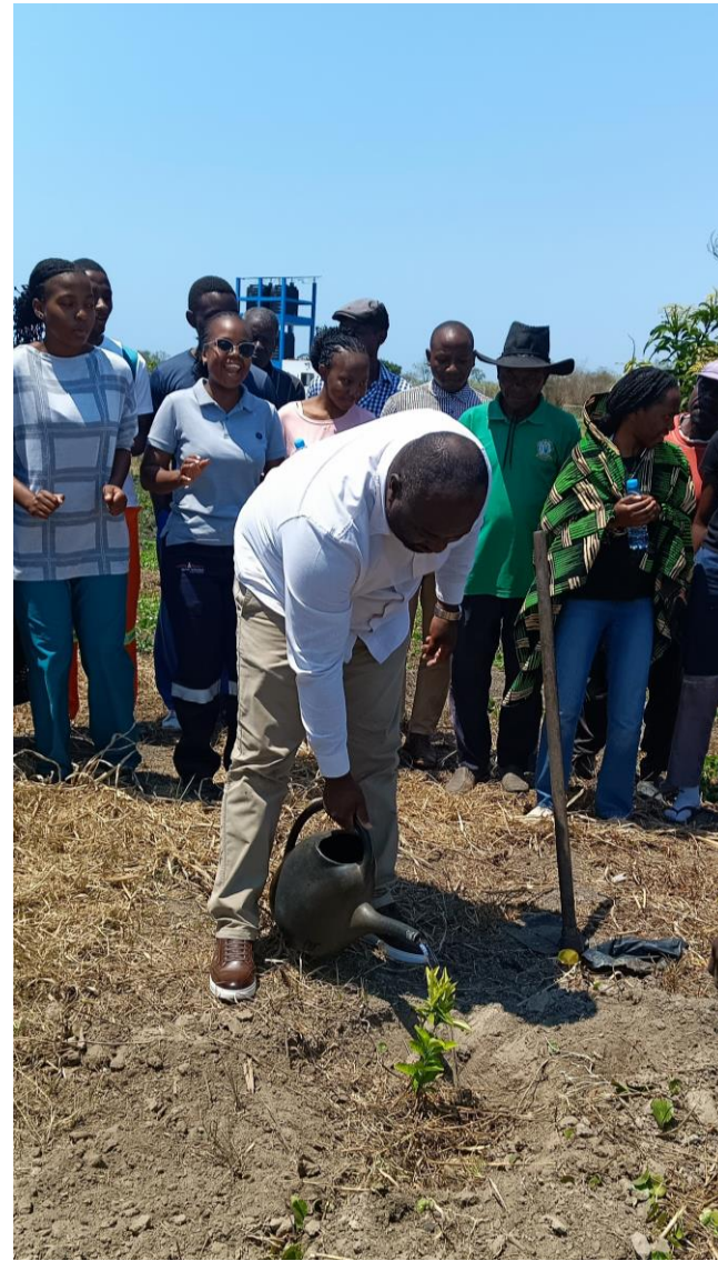
Foto: Rogério Chiau - Director Provincial da Juventude, Emprego e Desporto da Província de Maputo plantando fruteiras