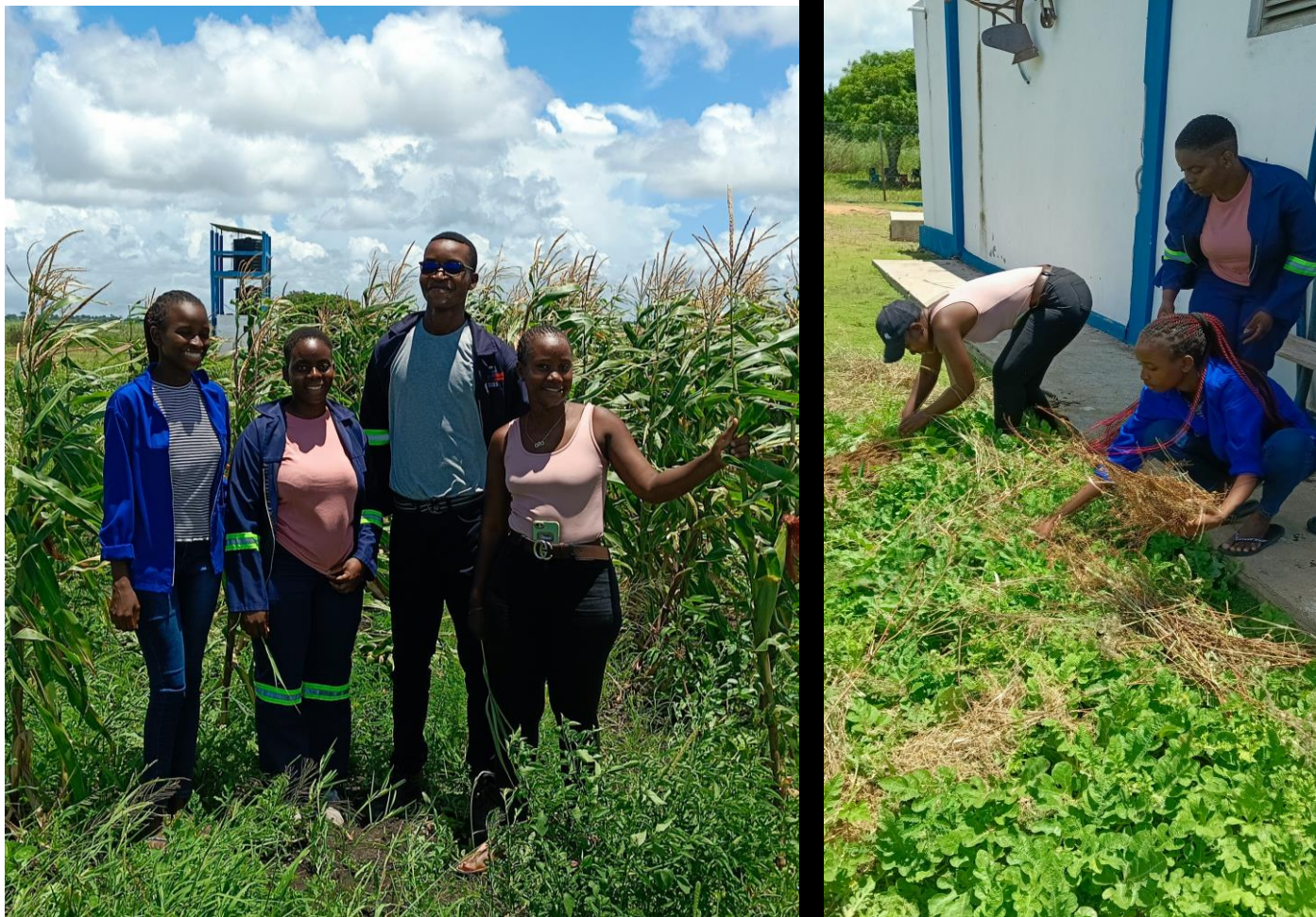
Foto: Estudantes do curso de Agropecuária da Faculdade de Engenharias e Tecnologias da Universidade Pedagógica de Maputo