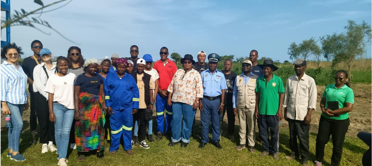
Foto Família: Administradora de Marracuene com todos os presentes na visita