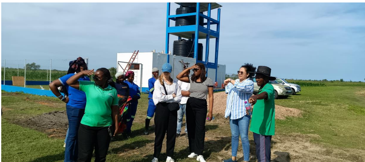
Foto: Participantes da visita apreciando as obras do projecto “Reabertura de valas de 1,3 km como estratégia principal para a mitigação da fome e aumento da renda dos jovens e das mulheres da Comunidade de Nhongonhane”